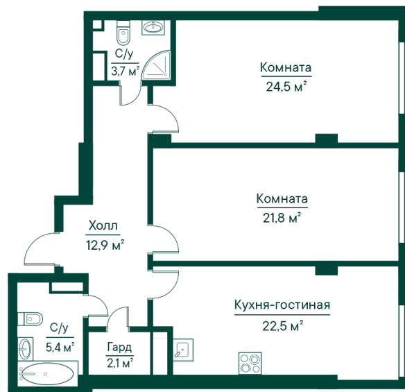
План в комплексе

СТОИМОСТЬ ДЕЙСТВИТЕЛЬНА НА 15 ЯНВАРЯ 2025 ГОДА