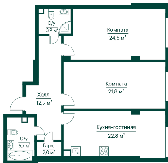
План в комплексе

СТОИМОСТЬ ДЕЙСТВИТЕЛЬНА НА 31 ДЕКАБРЯ 2024 ГОДА